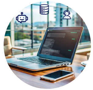
Productividad e inteligencia empresarial.