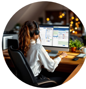
Contact Center de avanzada.